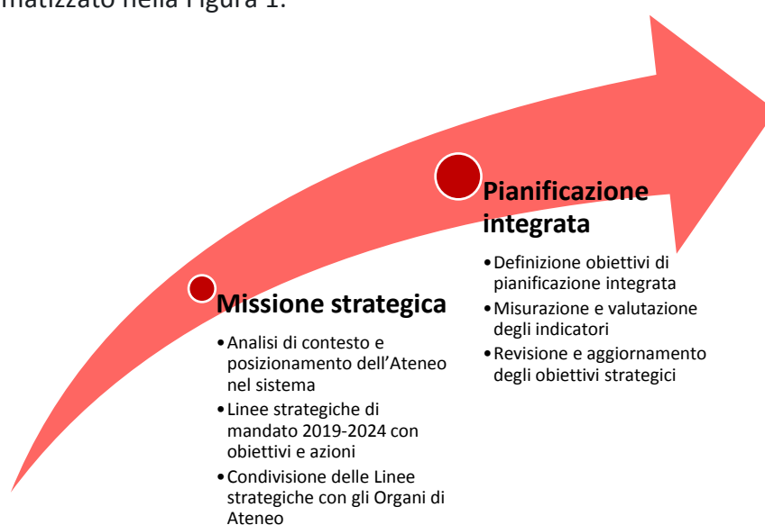
Figura 1. Il processo di pianificazione strategica.

Dalla missione di mandato discendono le linee strategiche , condivise con le singole articolazioni dell'Ateneo e i relativi Organi, che orienteranno la futura azione di governo e forniranno le basi per lo sviluppo della pianificazione integrata globale dell'Istituzione, per il monitoraggio e il controllo periodico degli obiettivi strategici, comprendendo tutte le sue articolazioni. Il processo può essere schematizzato nella Figura 1: