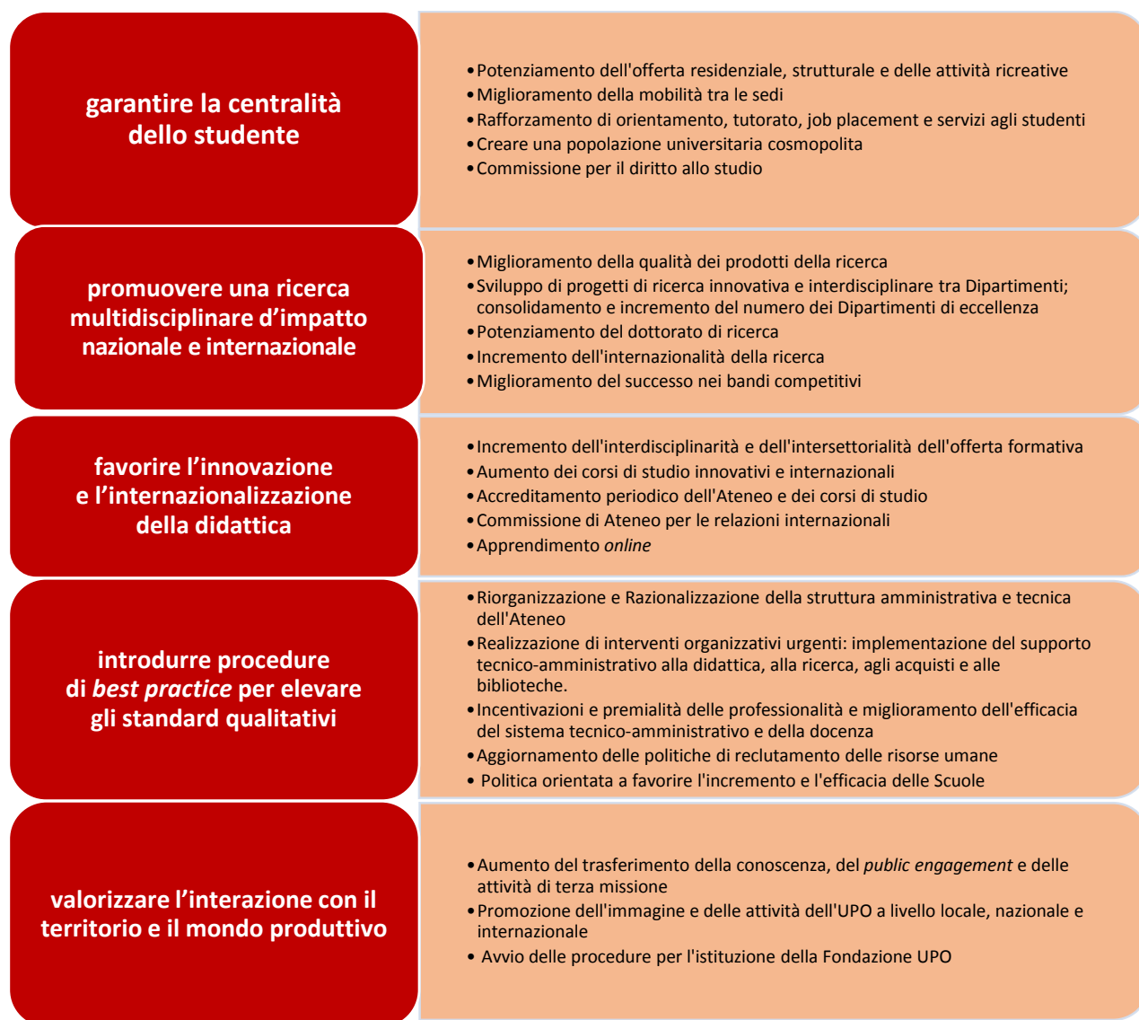
Figura 3. Schema sinottico delle linee e degli obiettivi strategici.

Il manifesto della visione si concretizza in cinque grandi linee strategiche, ciascuna delle quali viene declinata in una serie di obiettivi strategici. In Figura 3 se ne enunciano i dettagli.