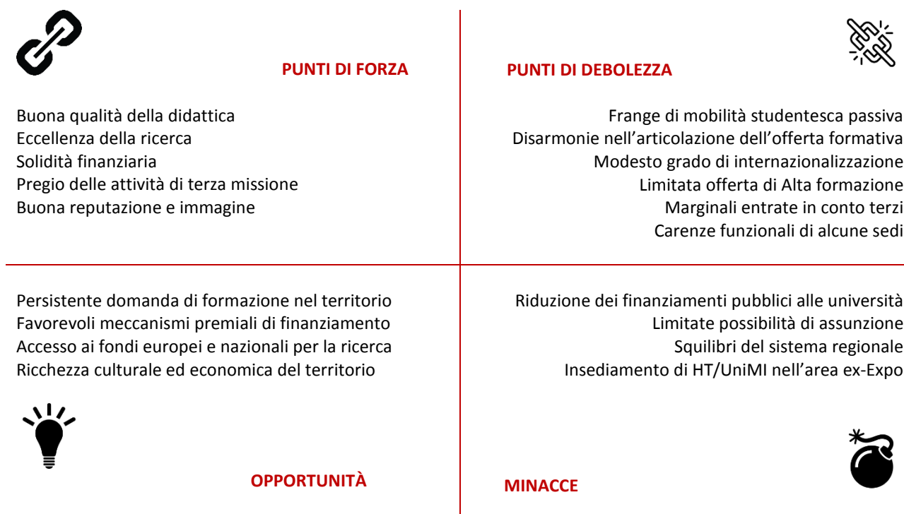
Figura 2. L'analisi SWOT.

L'analisi delle condizioni interne dell'Ateneo e del suo contesto esterno globale è indispensabile per tracciare un punto di partenza nell'identificazione e nel disegno degli obiettivi e delle linee strategiche. Questa analisi è stata condotta attraverso l'utilizzo di diverse fonti di dati: audit e ricognizioni interne, interazioni con le parti sociali, benchmarking con i principali competitor , audizioni di rappresentanti di studenti, PTA e corpo docente, indagine su edifici, risorse materiali, immateriali e informatiche, consultazione di database sulla ricerca e sull'offerta formativa a livello nazionale e internazionale. Infine, sono stati utilizzati i risultati della visita di accreditamento dell'ANVUR nel dicembre 2016 e le relazioni del Nucleo di Valutazione.